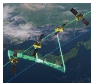
方向変更観測モード Changing direction observation mode