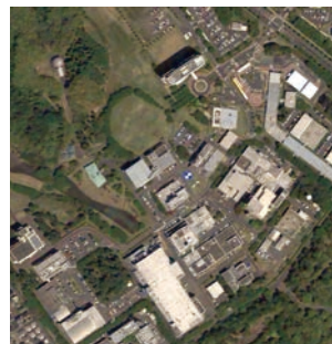
筑波宇宙センター 「だいち3号」0.8m分解能 (シミュレーション画像) ALOS-3 0.8m resolution (Simulated image)