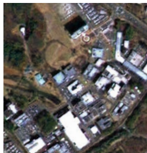
筑波宇宙センター 「だいち」2.5m分解能 JAXA Tsukuba Space Center, Ibaraki Pref., Japan ALOS 2.5m resolution

The optical sensor onboard ALOS-3 will improve its ground resolution by approx. three times from that of ALOS (2.5 to 0.8 m at nadir) while maintaining a wide-swath of 70 km at nadir. Such a high-resolution sensor with a wide-swath is a unique characteristic of the sensor, which is achieved using maximize our accumulated knowledge and manufacturing technology for a large optical system and a high resolution detector.