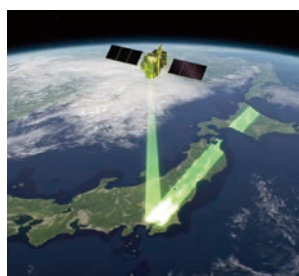
ストリップマップ観測モード Strip map observation mode

衛星の進行方向とは異なる方向へ衛星の姿勢を連続的に変更し、広範囲の沿岸域など、対象の地形に応じた観測をします。