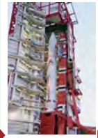
組立てられたロケットは