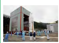
M組立室からフェアリングをM整備棟へ移動させます