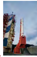
M整備棟の扉がひらいてランチャー（発射台）が旋回し、射点へ移動します